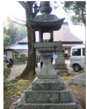
大神宮さんの燈籠

上宮寺の境内にある「大神宮さん」は、伊勢の大神さんで、伊勢参りの代わりに行くところです。各家でもち米を2、3合ずつ持ち寄って、大神宮さんの前で2臼ついてお鏡を2つ作り、大神宮さんと春日神社に供えます。お神酒を供えてお参りをしたら、すぐに、皆で焼いたり、餡（あん）つけにしたりしていただきます。