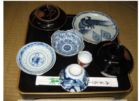
当屋で保管されている「椀物」一式

15日は、ご先祖様を送る日で、もうお盆も終わりで家にいます。送る前に大きなスイカを一つ割る家もあります。線香をたいてお迎えと同じように煙で送る家もあれば、ご先祖様が帰るためにお弁当（握り飯）をつくり、お供えのお下がりや花と一緒に、藁でつくった松明の火でご先祖様を送っていく家もありました。今は、松明は使われないようです。各家によって、どこまで送っていくかが決まっています。